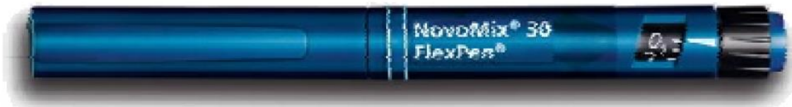
نوومیکس (انسولین مخلوط)