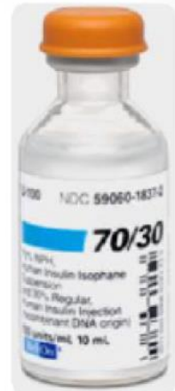
ن مخلوط (۷۰/۳۰)